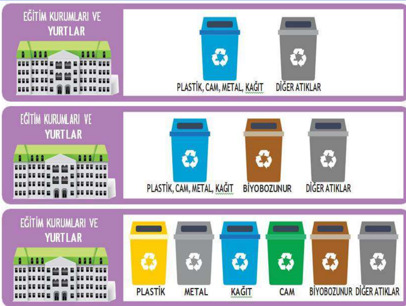
ekil 6. Ayrı biriktirme modelleri*

Bu anlamda sınıf ii temizlik kovaları kaldırılarak koridorlara ynetmelikte n grldg ekliyle uygun geri dnm aparatları yerletirilmitir.